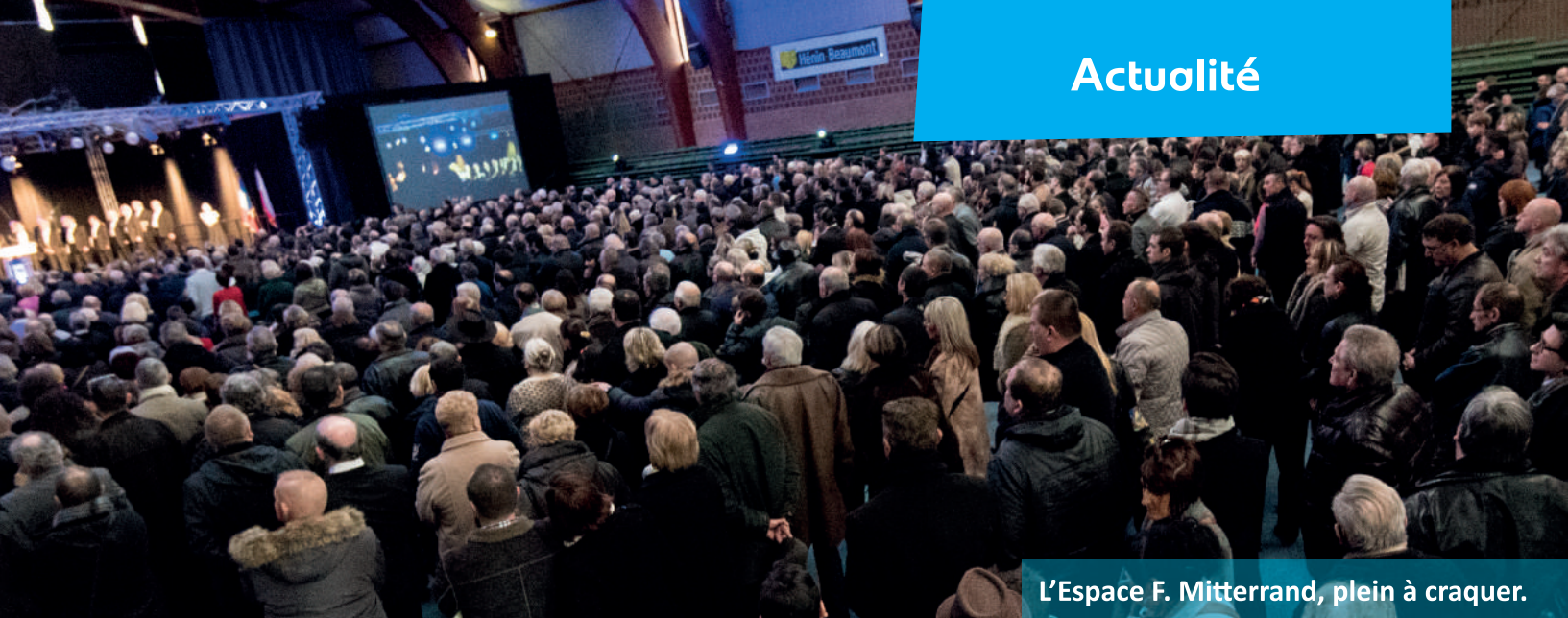
L'Espace F. Mitterrand, plein à craquer.