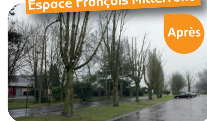
Espace François Mitterrand