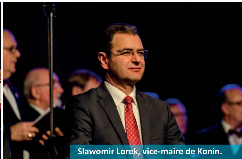
Slawomir Lorek, vice-maire de Konin.