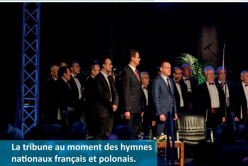
La tribune au moment des hymnes nationaux français et polonais.