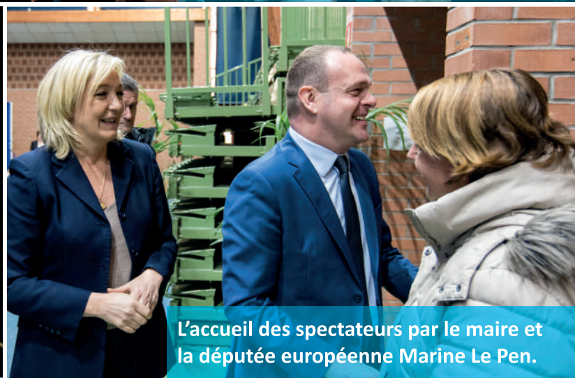
L'accueil des spectateurs par le maire et la députée européenne Marine Le Pen.